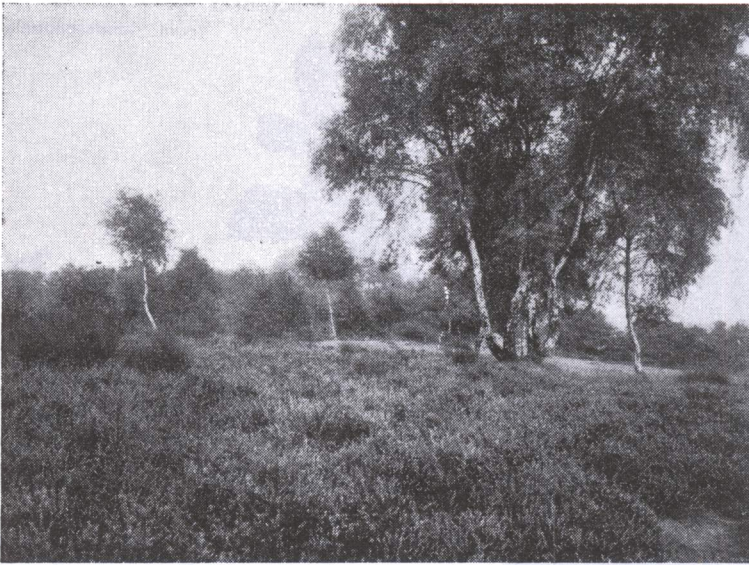
In der Bönning hardt