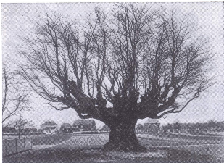
Kaiserbuche in Schwafheim