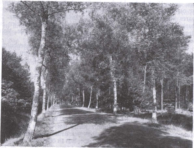
Birkenstraße zwischen Sons- beck - Kapellen

Eine Libanon-Zeder von 2 m Umfang wächst im Park von Haus Wolfskuhlen bei Rheinberg. Von den beiden Mammutbäumen im Moerfer Park, die unter den schweren Frostwintern 1940-42 schwer gelitten haben, mißt der stärkste Baum 2,25 m Umfang.