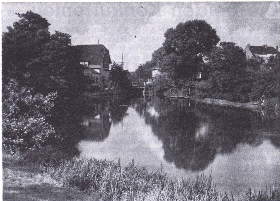
Am Stadtgraben in Moers